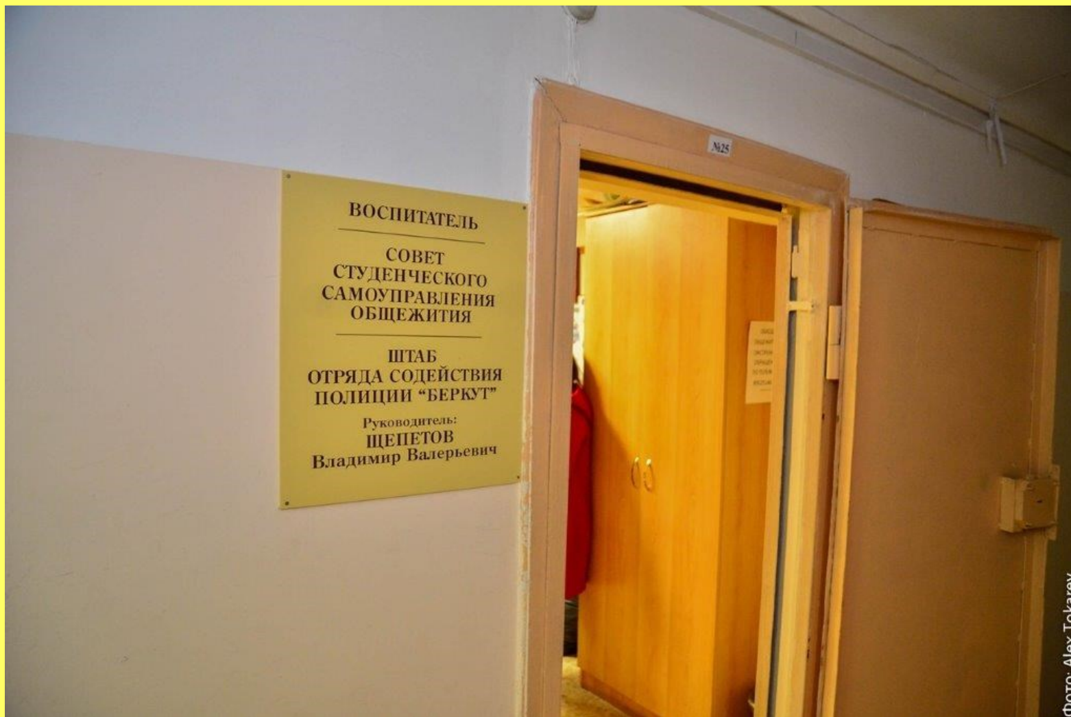
Штаб ДНД «Беркут»